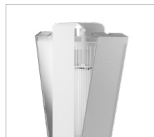
Możliwość jedno lub dwustronnej bezpośredniej dezynfekcji powierzchni.