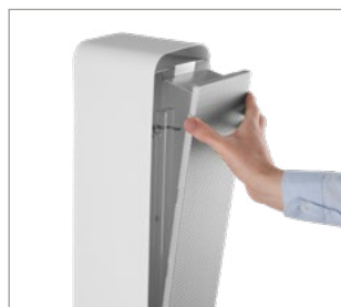
Zdjęcie przestony umożliwia bezpośrednią dezynfekcję powierzchni.