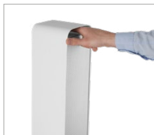
Wygodny uchwyt otwierający oraz otwór do przenoszenia lampy.

Po otwarciu przestony źródła światła wystarczy skierować lampę bezpośrednio na powierzchnię przez określony czas, aby skutecznie ją zdezynfekować. Należy jednak pamiętać, że światło UV-C jest szkodliwe dla skóry i oczu. Wykorzystując lampę w tej formie nie można znajdować się w zasięgu strumienia światła, a przed jej użyciem wymagane jest zapoznanie się z instrukcją obsługi dołączonej do produktu.